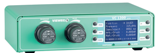
Ventilsteuergerät VC1380 Art.-Nr. 507722