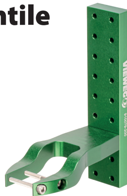
Ventilhalter für Jet-Ventil Art.-Nr. 504094