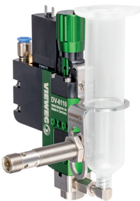
Halter für Kartuschen und Leermeldung 30 cc Art.-Nr. 502904