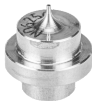
Nadeldüse für Jet-Ventil, 250 µm Art.-Nr. 502920