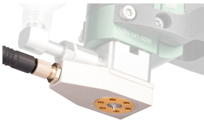
Düsenheizung für Jet-Ventil DV-6110 Art.-Nr. 507752